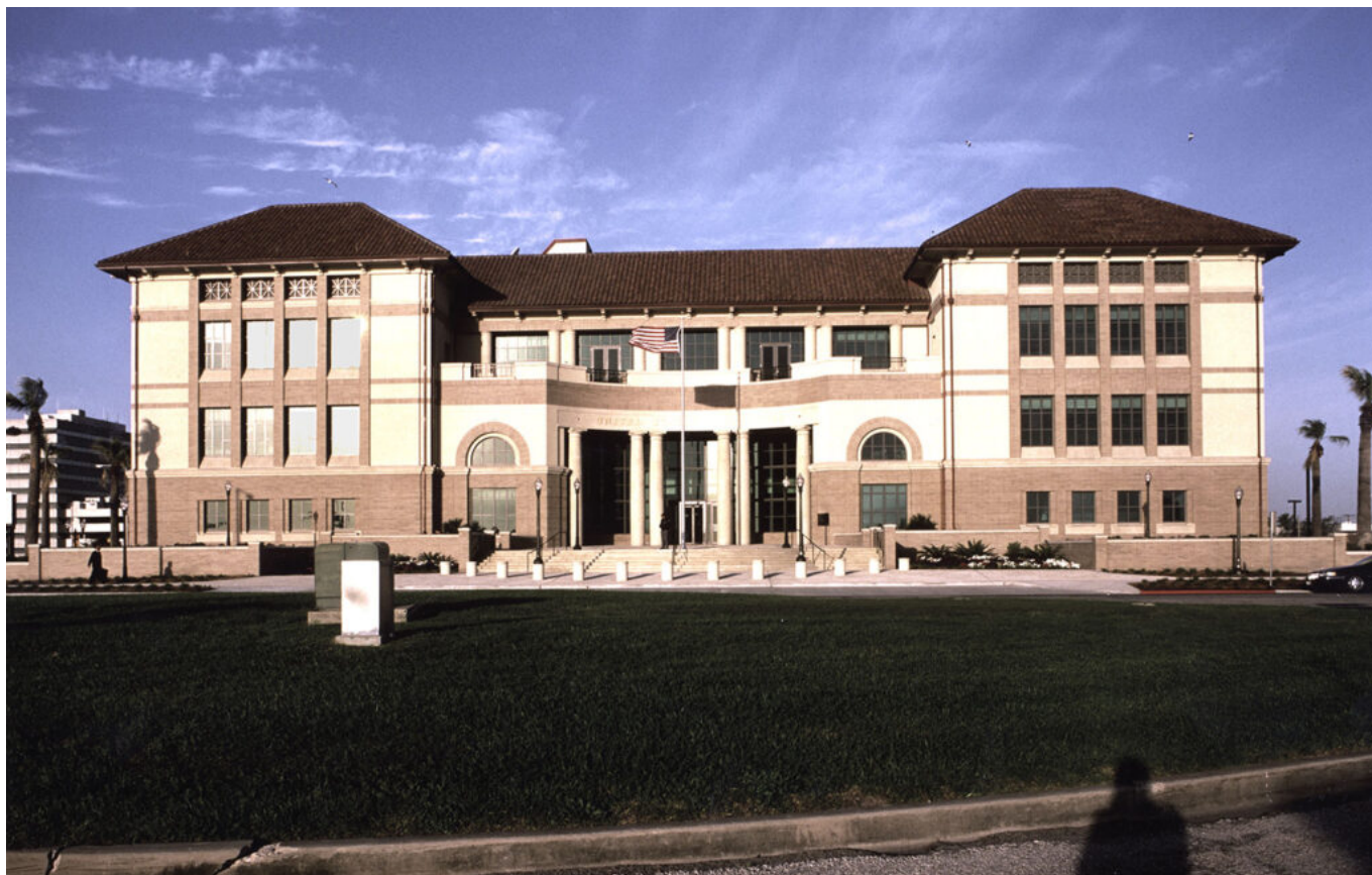
Hartman-Cox Architects, Corpus Christi Courthouse