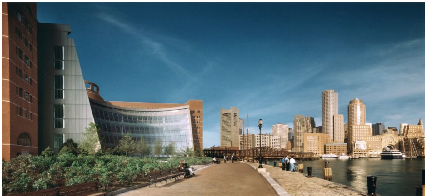
Pei Cobb Freed & Partners, Moakley United States Courthouse and Harborpark, Boston

Nessun programma edilizio governativo poteva ragionevolmente produrre lavori apprezzati da tutti, tanto meno un capolavoro dopo l'altro, ma la credibilità e la professionalità del programma Design Excellence hanno suscitato il rispetto e la fiducia di molti.