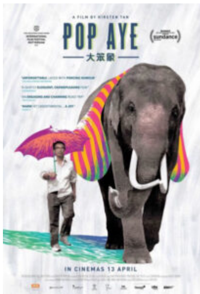
Pop Aye Kirsten Tan - 2017 SGP

Sotto le nuvole elettriche. Kiev, Ucraina. L'architetto Petr (Louis Franck) vaga in un limbo elettrico alla ricerca del perché la realizzazione del suo grattacielo si sia fermata. Il cantiere in abbandono, lo scheletro dell'edificio, sono icone mescolate con i resti delle vestigia staliniane. «Sono un architetto. Molto di tendenza, ma privo di senso. Sistema vasche da bagno e lavandini nello spazio e nel tempo».