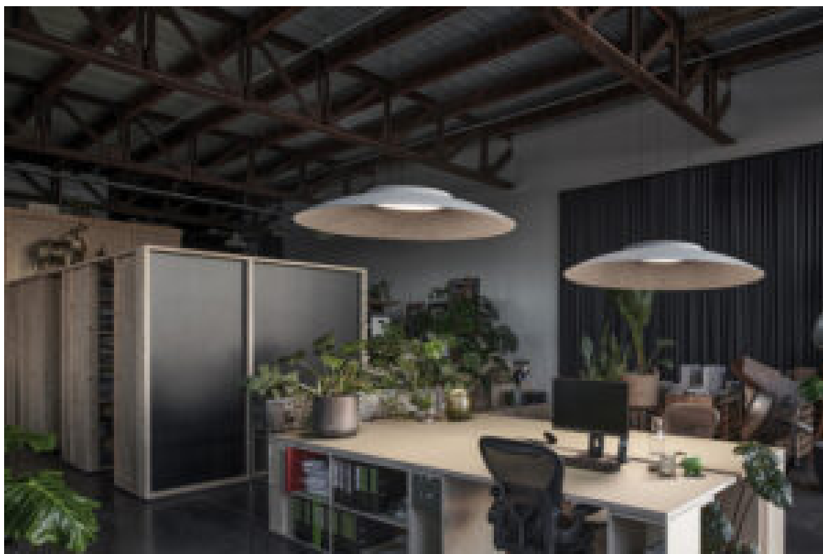
La lampada Zoover con la caratteristica cupola in feltro