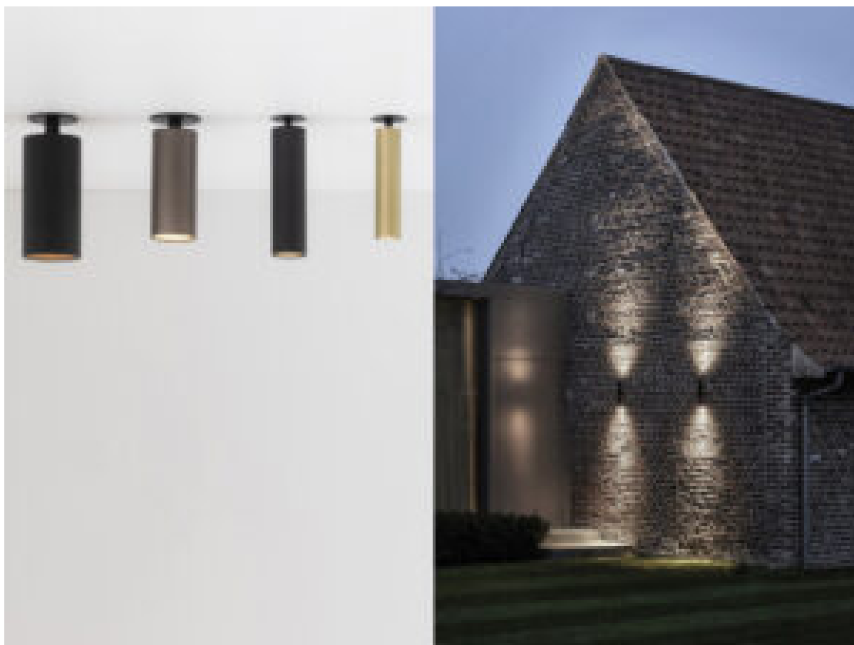
La rinnovata gamma Spy è utilizzabili indoor e outdoor