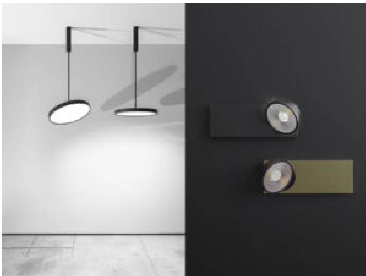
Le luci Haloscan e Multinova