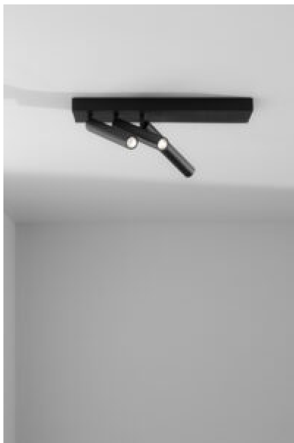
Le luci Uho

Come accade dal lontano 1997, The Lighting Bible continua a presentare in dettaglio la nuova produzione Delta Light, che quest'anno mette in relazione tecnica, eleganza e comfort.