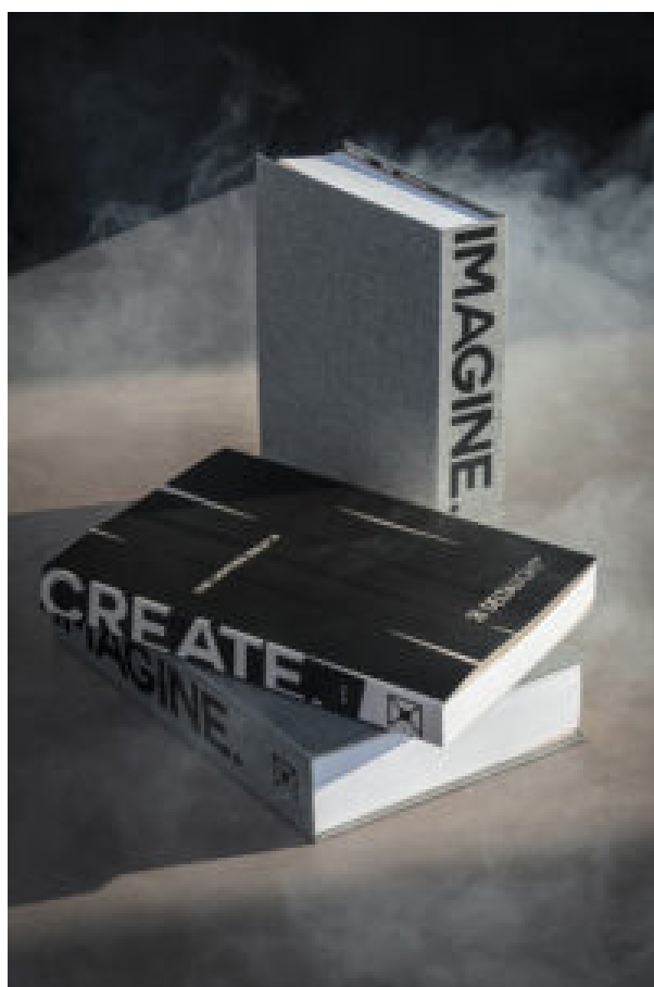
Le due edizioni del catalogo 2021

dell'illuminazione e del benessere dell'individuo, in linea con l'idea del nostro fondatore Paul Ameloot".