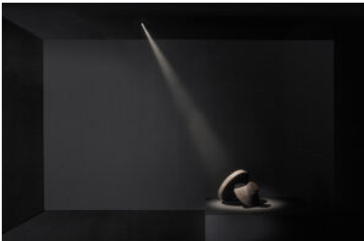
Nime, la lampada da incasso firmata da Dean Skira

dei prodotti, e Lighting Bible 14 - Imagine , dedicata ai progetti architettonici che li vedono protagonisti.