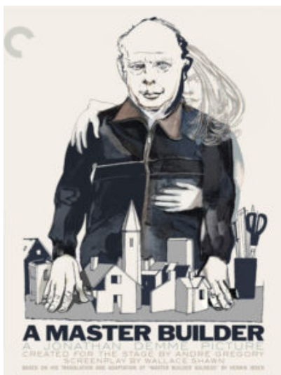
A Master Builder (Jonathan Demme) - 2013 USA - Wallace Shawn

Il castello in aria. A Londra l'architetto Albert Samson è un invasato della professione. Nella sua vita ha dato tutto quel che aveva nei progetti che realizzava, ville o chiese che fossero. Arrivato al top nel lavoro, diventa despota in famiglia, e soprattutto non vuole che il figlio dell'ex socio, anche lui architetto, lasci il suo studio o prenda iniziative progettuali. Padre, padrone e architetto. Morirà cadendo da una torre costruita per la promessa fatta a una giovane donna anni prima.