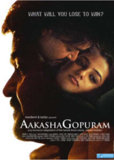
AakashGopuram, Castle in the Air (K. P. Kumaran) - 2008 IND - Mohanlal

Il castello in aria. A Londra l'architetto Albert Samson è un invasato della professione. Nella sua vita ha dato tutto quel che aveva nei progetti che realizzava, ville o chiese che fossero. Arrivato al top nel lavoro, diventa despota in famiglia, e soprattutto non vuole che il figlio dell'ex socio, anche lui architetto, lasci il suo studio o prenda iniziative progettuali. Padre, padrone e architetto. Morirà cadendo da una torre costruita per la promessa fatta a una giovane donna anni prima.