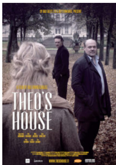
Theon talo, Theo's House ( Rax Rinnekangas ) - 2014 FI - Hannu-Pekka Björkman, Ville Virtanen

Rio ti amo. Rio de Janeiro. "Sono un costruttore e, come costruttore, so che la fortuna non esiste, ma sono anche un architetto e in quanto tale so che la fortuna si può costruire". Il vecchio e ricco architetto James insegna alla bella Dorothy che la fortuna ha un prezzo.