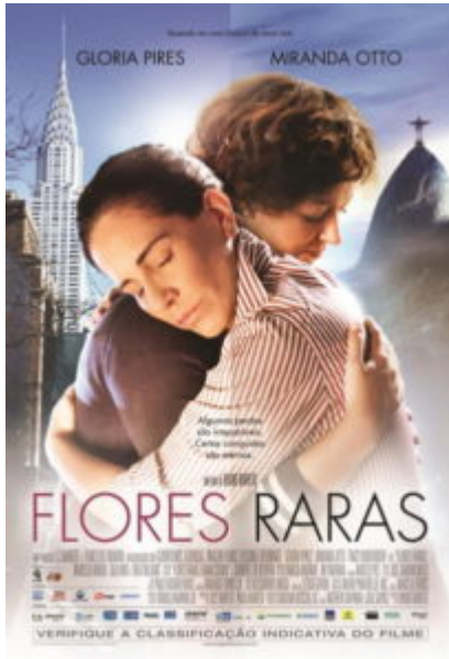
Flores Raras, Reaching for the Moon ( Bruno Barreto ) - 2013