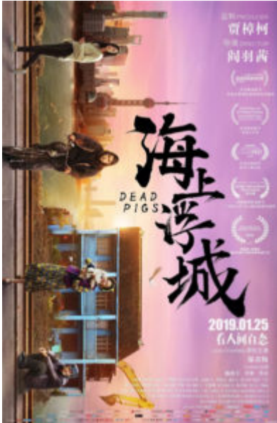
Dead Pigs , 海上浮城 (Cathy Yan) - 2018 CN/USA - David Rysdahl

La città galleggiante sul mare. Un allevatore, la proprietaria di un salone di bellezza, un cameriere, un architetto e una ragazza s’incontrano mentre migliaia di maiali morti galleggiano sul fiume che porta a Shanghai. L'allevatore perde il proprio sostentamento quando i maiali muoiono misteriosamente in tutto il paese. La sorella combatte per salvare la casa di famiglia dalla gentrificazione imperante, mentre un architetto americano, Sean Landry, guida lo stesso progetto per farsi un nome. In realtà agisce come tanti altri progettisti occidentali allettati dal boom edilizio legato al violento inurbamento “governativo” di 300 milioni di cinesi e dalla chimera di fama e facili guadagni. Il gioco del mercato internazionale della progettazione lo porterà a credere di avere qualche speranza, ma l’effetto “scatole cinesi” si dimostrerà ancora una volta ipnotico, truffaldino, manipolatore. La sua figura umana si riabilita nel finale quando lui ferma i bulldozer che stanno per radere al suolo la casa. Nonostante il finale in musica, stile Bollywood, la casa verrà abbattuta. E sul fiume, al posto dei maiali, ora galleggiano anatre morte. Divinatorio.