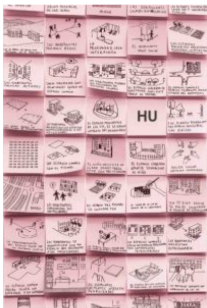
HU, common spaces in housing units , di Rozana Montiel, Arquine, 2018, 215 pagine, 19,90 euro

Disegno dopo disegno si svolge il dialogo diretto con l'utente, dando forma ad una guida all'autocostruzione , tanto generale quanto efficace nel dare indicazioni sulle proporzioni, sulle funzioni, sui materiali e che mai perde di vista il vero obiettivo: « costruire un tetto senza l'aiuto di uno specialista ». Emerge nelle oltre 400 pagine del volume la volontà di fare dei manuali un aiuto concreto , così come si percepisce il riguardo discreto, il tocco lieve verso lo stato di necessità del lettore: un'esperienza che Friedman aveva conosciuto in prima persona, quando, in fuga dalla persecuzione nazista, si era trovato lui stesso senza un tetto.