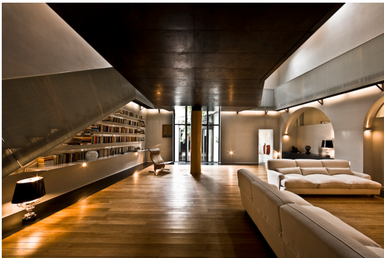
MdAA, Tree House a Roma, unico studio italiano ad aggiudicarsi un primo posto (sezione Residential), WAF Interior 2015

del London Festival of Architecture - partito da Barcellona nel 2012 e planato accidentalmente sulla moquette di un casinò. L'edizione di Berlino potrebbe essere l'occasione per risolvere il conflitto d'interessi che vede (da sempre) alcuni componenti delle giurie essere anche concorrenti in gara nonché professionisti molto vicini al direttore e alla sua cerchia. Inoltre sarebbe utile ridurre i prezzi dei diversi pacchetti/tickets che, oltre a tagliar fuori una grossa fetta di pubblico giovane, sembra far desistere progettisti sezionati dal partecipare all'evento, dovendo anche coprire le spese della trasferta, senza avere nessun riscontro concreto se non quello di vedersi citati nel sito del festival. Il fatto poi che non ci sia un catalogo a testimonianza di un "anno mondiale di progettazione", non aiuta a riflettere sul reale contributo che questa rassegna dà all'architettura.