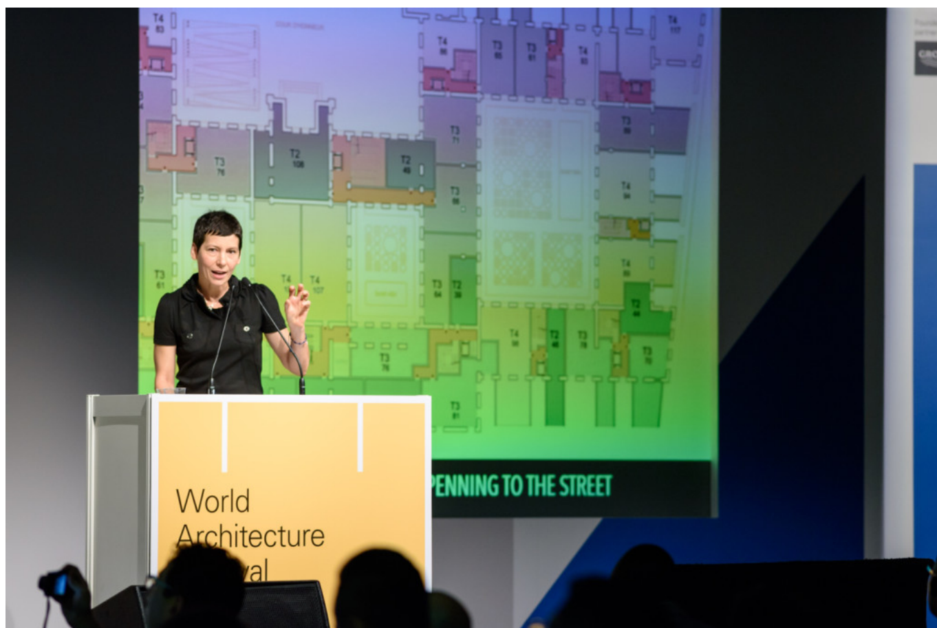
Manuelle Gautrand, WAF 2015

A fare da cornice all'evento è stata la mostra dei progetti selezionati , elaborati da studi di 46 Paesi e raggruppati in 30 categorie per un totale di 338 opere . Ognuna si è contesa gli awards non solo delle rispettive sezioni di appartenenza ma anche delle tre grandi "famiglie": " Future Projects ", " Landscape Projects " e " Completed Projects " da cui è stato scelto il " Building of the Year " che quest'anno è andato a The Interlace di Singapore , firmato da Ole Scheeren quando era ancora partner di OMA. Il complesso residenziale è stato selezionato dal super jury , composto per l'edizione 2015 dagli architetti Peter Cook, Sou Fujimoto, Manuelle Gautrand affiancati da Alan Balfour, direttore di ArchDaily - il weblog di architettura che con i suoi 300.000 collegamenti/giorno è nel settore il più cliccato al mondo. Il verdetto dei vincitori è stato reso noto in occasione della cena di gala di venerdì 6 che ha chiuso la tre giorni di Singapore, diretta come sempre dall'inossidabile Paul Finch, deus ex machina nonché fondatore del Festival.