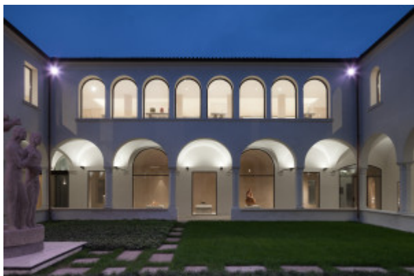
Chiostro interno.

Lo schermo massiccio della facciata è feso da poche aperture che, a livello terra, consentono di traguardare gli interni e il chiostro, dove si scorge il gruppo scultoreo «Adamo ed Eva» di Arturo Martini (1931).