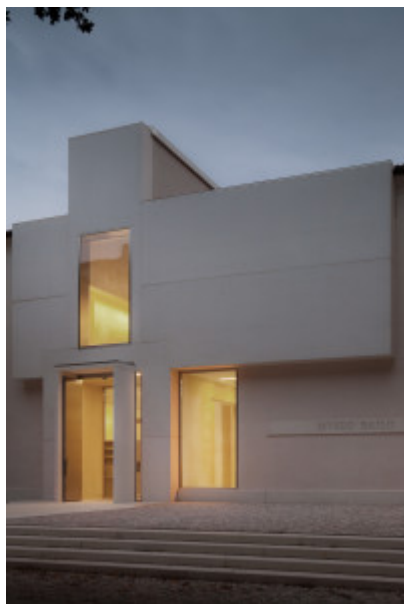
Museo L. Bailo.

Oggi, dopo due anni e mezzo di cantiere e un finanziamento europeo di circa 3,3 milioni (più 1,7 del Comune), una prima porzione (il chiostro sud e il primo piano) accoglie le collezioni di Otto e Novecento trevigiano. Oltre 300 opere su una superficie complessiva di 1.800 mq , tra spazi dedicati a collezione permanente, mostre temporanee, sala polivalente, uffici e depositi. Per la seconda tranche di lavori bisognerà attendere ulteriori finanziamenti (spesa prevista, 3,5 milioni).