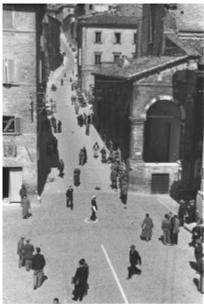
Urbino, il centro storico in una foto d'epoca