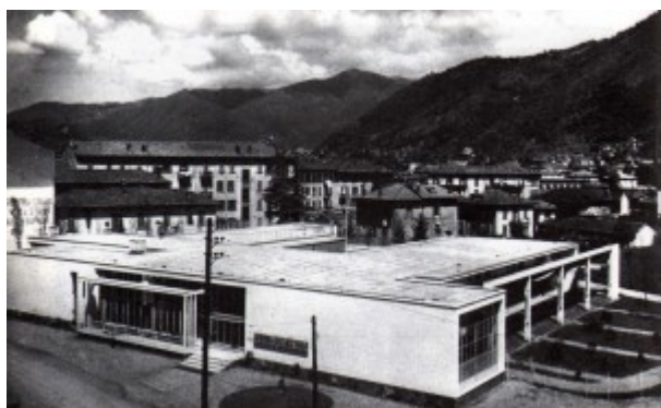
Giuseppe Terragni, asilo Sant'Elia a Como (1936)