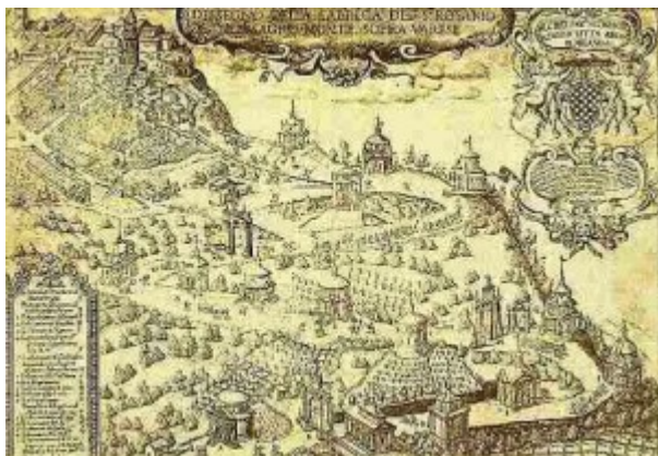
Il Sacro Monte di Varese

Nella sovrapposizione di luoghi c'è, spiega ancora Ferlenga, “un valore aggiunto che amplia le possibilità offerte dalle mostre e dà ulteriore senso di riflessione e scoperta alla rete immaginata da Triennale Xtra” . Fatto interessante, soprattutto in un momento di ripensamento e trasformazione del modello su cui la Triennale ha sviluppato finora la propria offerta culturale. Nel 2016 (dal 2 aprile al 12 settembre) è infatti programmata la 21° edizione della Triennale - a 20 anni di distanza dall'ultima , dal titolo «Identità e differenze». Da allora era prevalso un modello alternativo, caratterizzato da attività continua e produzione culturale quotidiana, con al suo interno un Museo del Design. In collaborazione con il Bie (il Bureau International des Expositions, organizzatore di Expo), si svilupperà il programma «XXI Secolo. Design after design» , diffuso in una serie di luoghi che affiancano quelli tradizionali del Palazzo dell'Arte e di Parco Sempione: dalla Fabbrica del vapore all'Hangar Bicocca, dai Campus del Politecnico a quello dello Iulm, dal Museo delle Culture alla Villa Reale di Monza. Iniziativa ambiziosa anche nel budget: circa 12 milioni, di cui 5 di finanziamento diretto della Triennale e dai contributi dei suoi partner e sponsor, 5 dalle quote di partecipazione e 2 dalle vendite dei biglietti.