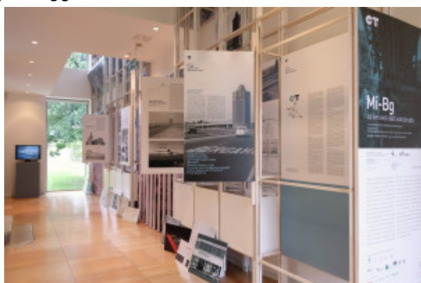
Un allestimento della mostra

Le migliaia di automobilisti che, dal 1927 a oggi, percorrono ogni giorno i 50 km dell'autostrada tra Milano e Bergamo, attraversano un territorio in continua evoluzione. L'ambizione della mostra - curata da Andrea Gritti, Paolo Mestriner e Davide Pagliarini e che si completa con alcune installazioni in spazi pubblici di Dalmine - è indagare il rapporto, emblematico e per tanti versi contraddittorio, tra il nastro di asfalto e i paesaggi che lo circondano.