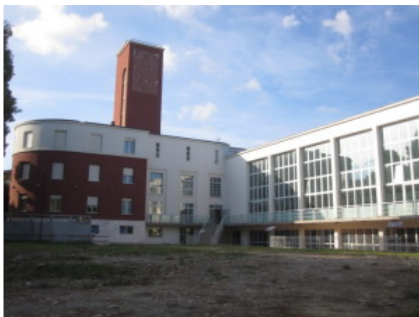
La torre con i corpi cultura -a sinistra - e sport