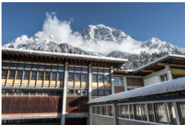
L'ex colonia oggi

In questo modo, seppur in forma ridotta e lontana dalla dinamicità di un tempo, l'ex colonia viene mantenuta viva, con uno sforzo culturale che ne conserva la memoria e stimola la riflessione attorno agli usi possibili per il futuro. Grazie a Dolomiti Contemporanee vengono organizzate periodicamente visite guidate, seminari, mostre, stage: alcuni padiglioni sono utilizzati come residenza per artisti che, ospitati temporaneamente e a rotazione, vivono all'interno delle strutture producendo opere d'arte che prendono ispirazione dall'architettura