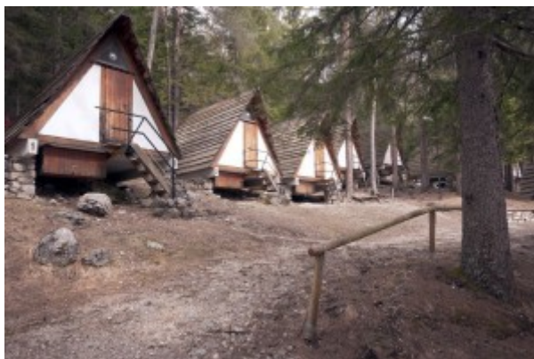
Le capanne del campeggio

La realizzazione del villaggio subisce un imprevisto arresto con la morte di Mattei, sopraggiunta tragica e improvvisa nell'ottobre 1962: al progetto verrà meno la volontà propulsiva del suo ideatore e non sarà mai portato a termine nell'ambizioso disegno originario, mai pienamente condiviso dai dirigenti Eni.