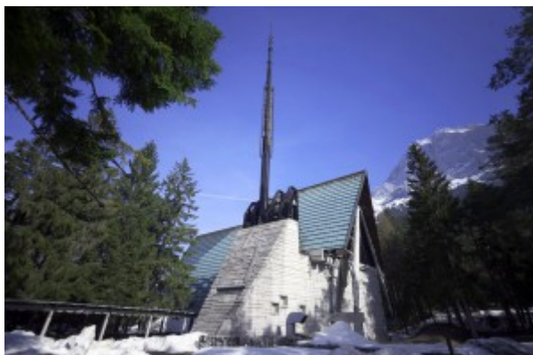
La chiesa di Nostra Signora del Cadore