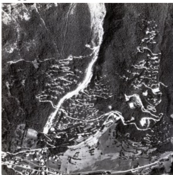
Foto aerea storica dell'insediamento con, ben visibile al centro, il canale di scorrimento dei detriti

L'ampio ventaglio funzionale è la premessa per pensare a un futuro riuso degli 80.000 mc della struttura dismessa che, in parte minima (non oltre il 15%), potrebbe anche essere convertita a residenza. Il Programma complesso Corte prevede inoltre che le aree libere potranno ricevere nuove edificazioni derivanti da interventi di rilocalizzazione di volumetrie attualmente esistenti in aree di dissesto geologico e idrogeologico e che, in parte, interessano anche l'ex villaggio.