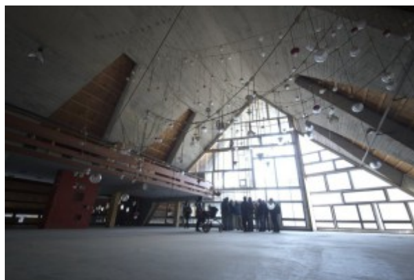
Interno dell'aula magna dell'ex colonia oggi

Tra il 1956 e il 1963 furono realizzate 270 abitazioni , raggruppate in quattro insiemi e completamente integrate nel nuovo bosco. Successivamente vengono costruiti il campeggio per 200 ragazzi, l'hotel, il residence e la chiesa, progettata da Gellner insieme a Carlo Scarpa e posizionata su un promontorio panoramico.