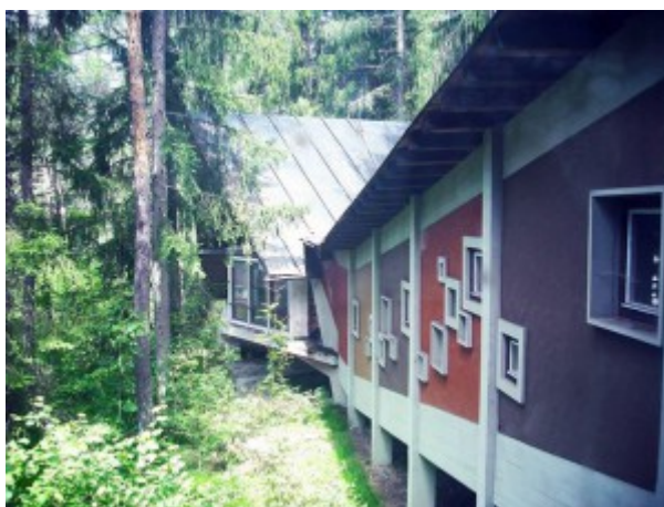
L'ex colonia oggi

originario occupava il ruolo principale, la colonia . Dismessa per oltre vent'anni, dal 2014 è al centro di un progetto di valorizzazione , denominato "Progettoborca" , ideato dall'associazione culturale Dolomiti Contemporanee insieme a Minoter con l'intento di ripensare e rilanciare questo emblematico luogo abbandonato della regione dolomitica. L'ex colonia è diventata una sorta di "cantiere" culturale in continua evoluzione , in cui si sviluppano attività poliedriche e multidisciplinari che contaminano il luogo con le espressioni dell'arte e della cultura contemporanee.