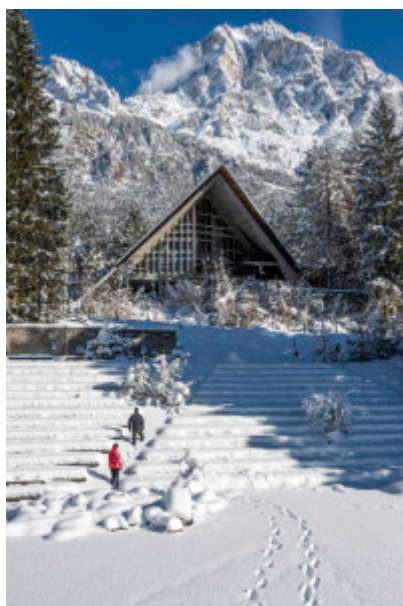
L'aula magna dell'ex colonia oggi, con il monte Antelao sullo sfondo