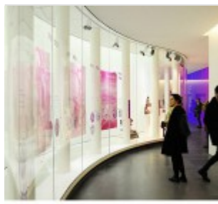
www.Museo2015.it, Per l'elenco degli spazi di 2015.it