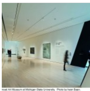
Broad Art Museum at Michigan State University.