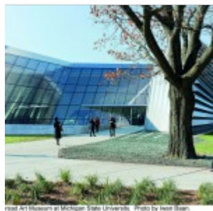
Broad Art Museum at Michigan State University.